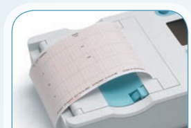
FÁCIL DE LEER

Le ahorrará un valioso tiempo y garantizará la captura precisa de los datos indicando conexiones y señales de calidad deficiente.